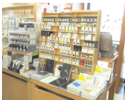
インクの色・種類も豊富

同社では、商品点数3万6千という品揃えの多さに加え、趣向性の高い商品の取り扱いに特に力を入れているといいます。他店では中々見ることができない珍しいメーカーでブランドイメージの高い物や、趣味としてデザイン性の高い物や、楽しむアイテム、文具女子博で人気の女性向け文具など、様々なジャンルを取り揃えているそうです。ネット社会で、簡易的に欲しい物がどこからでも手に届く時代であっても、多くのファンが市内のみならず遠方からも足を運んでいるといいます。文房具が