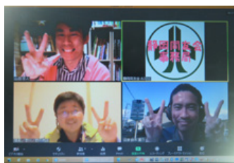
ZOOM参加の受講生・スタッフ

2日間で開催した本発表会には、受講生が経営指針書を冊子にして持参。1日目は受講生が社長の決意、経営理念、将来のビジョンを、指