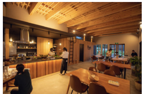
creative base Think

前述の経営理念を掲げ「創造力が未来を幸せにする」というビジョンのもと、クリエイティブの力を育て、発揮し、社会に貢献できる人・仕事をつくっていきたくいと津賀氏。会社という組織の枠を超えて地域の人と広くつながり、お互いに創造性を発揮しあえるVillage運営(村づくり)へと舵を取ります。今後は教育事業にもさらに力を注いでいくと話