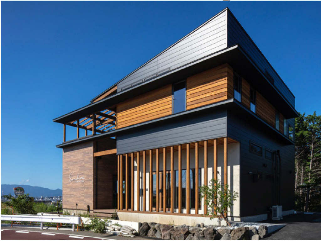
2020年8月に移転した新社屋