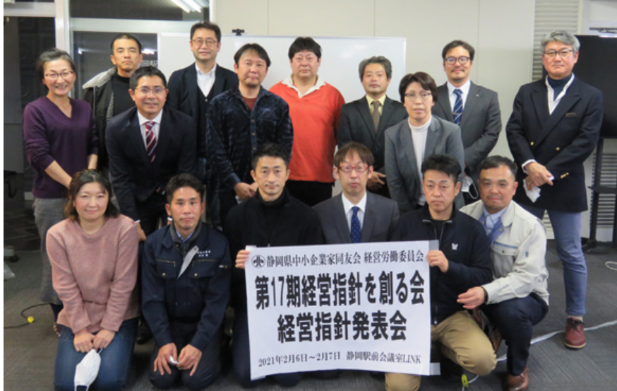
第17期経営指針を創る会の受講生・スタッフ一同

2020年7月から開講した第17期経営指針を創る会(※以下創る会)。本年は全講でZOOMを併用して開催し、受講生9名が経営指針を発表しました。