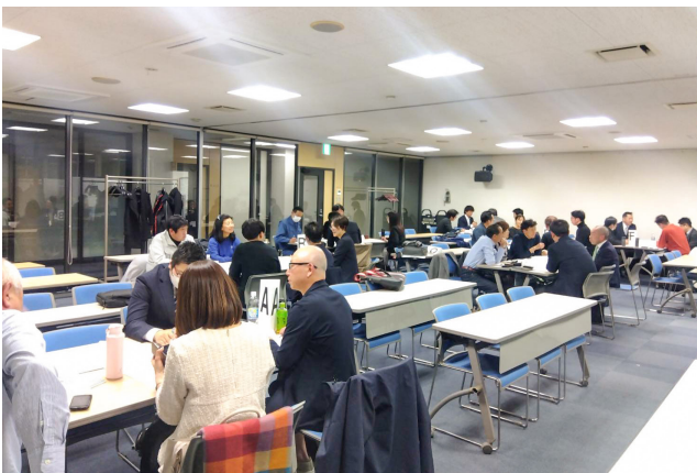
グループ長の役割や進行の流れについて学び合う

グループ長の役割や進行の流れを学んだ後、経営実践の報告(ミニ報告)を聞き、グループ討論を実施。最後にグループ討論の進め方を振り返ることで理解を深めていきます。2025年度後半からは7月に開催される中協第58回定時総会in静岡にむけ