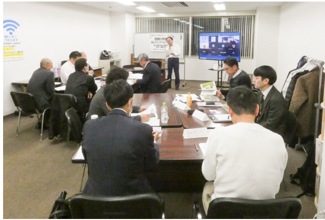
聴覚障害をテーマに学びを深める

経営理念や行動指針と結び付けて、自社としてどのような在り方を目指すのか整理することの重要性が語られました。また、障害を一括りに捉