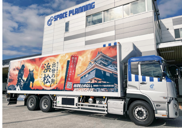
ラッピングトラック