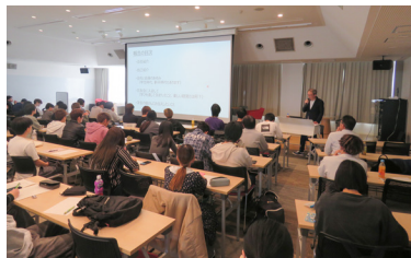
産業大学冠講座がスタート

静岡同友会は、2025年12月に私立大学の静岡産業大学と連携及び協力に関する協定を締結しました。この協定は「地域社会との連携を図り、地域の実情やニーズを把握のうえ、地域の活性化・人材育成等のために協力し、地域社会の様々な課題解決に向けた取組みを推進すること」を目的としています。この連携の一環として今回より上期の一講義として冠講座が開講しました。