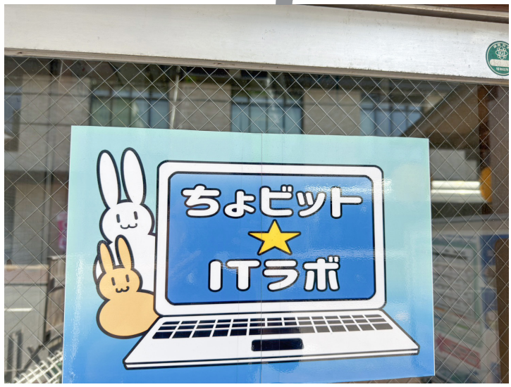
時代を追いかける人を応援するITサロン

「ITまわりの困りごとを支える」 (有)テラ・テクニカルアシストは、小規模企業を中心に、PC本体・周辺機器の修理・調整、ネットワークメンテナンス、業務ソフトの導入支援など、いわゆる「ITまわりの困りごと」を支える企業